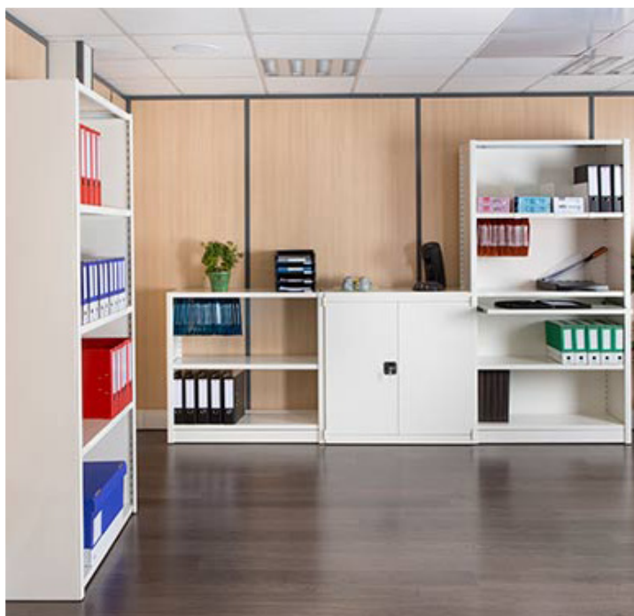
Idéal pour l'aménagement de bureaux